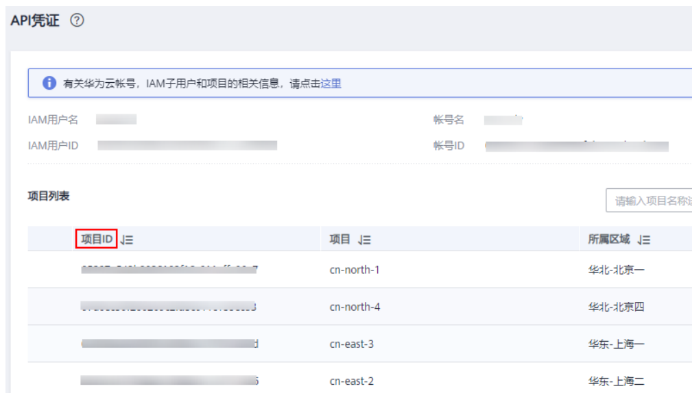
图 8-1 查看项目 ID