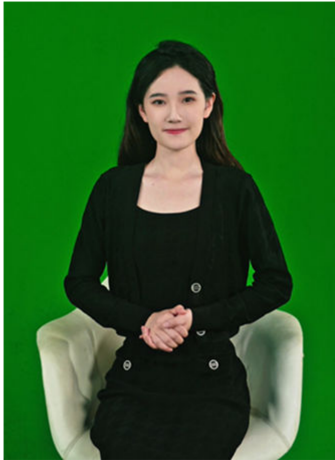
图 1-3 拍摄示例（确保手势不出画面）