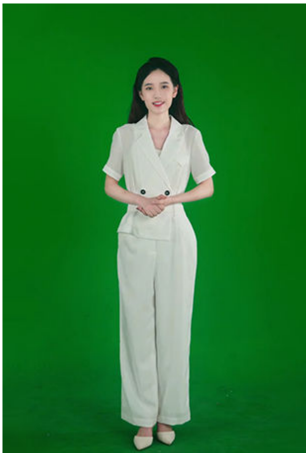
图 1-2 拍摄示例（绿幕完全覆盖）