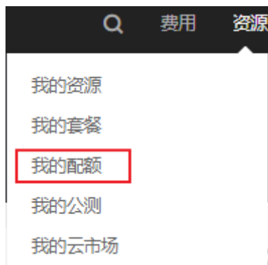
图 1-2 我的配额