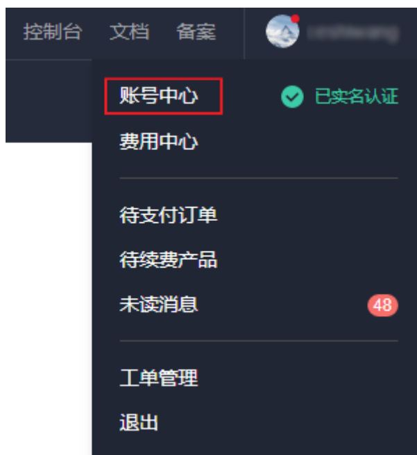
图 4-1 账号中心