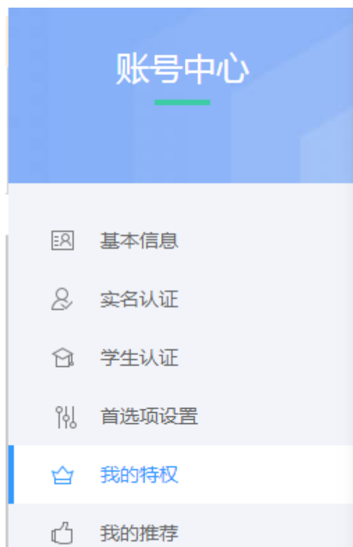
图 4-2 我的特权