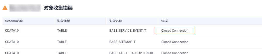
图 3-1 错误显示

执行数据库评估项目，“项目状态”中的“对象收集错误”显示错误“Closed Connection”。