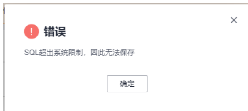
图 4-1 报错显示