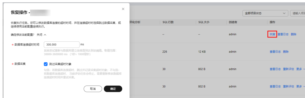
图 3-2 恢复操作