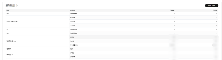
图 1-1 申请扩大配额

步骤3 在“新建工单”页面，根据您的需求，填写相关参数。其中，“问题描述”项请填写需要调整的内容和申请原因。