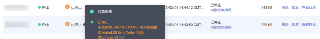
图 3-3 报错信息