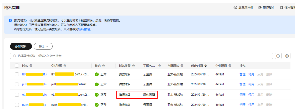
图 2-2 域名管理