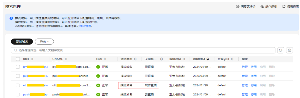
图 2-1 域名管理