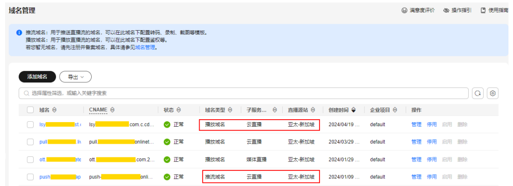
图 2-3 域名管理