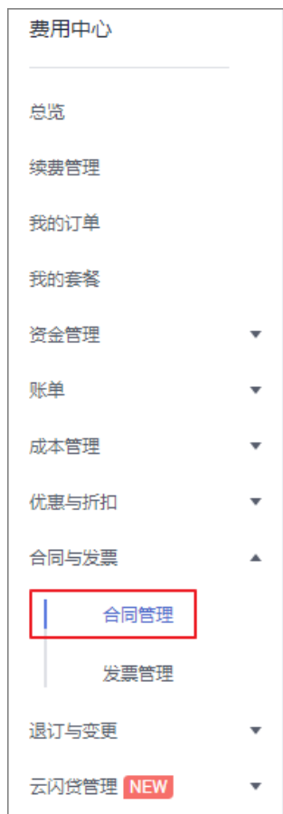
图 1-6 费用中心