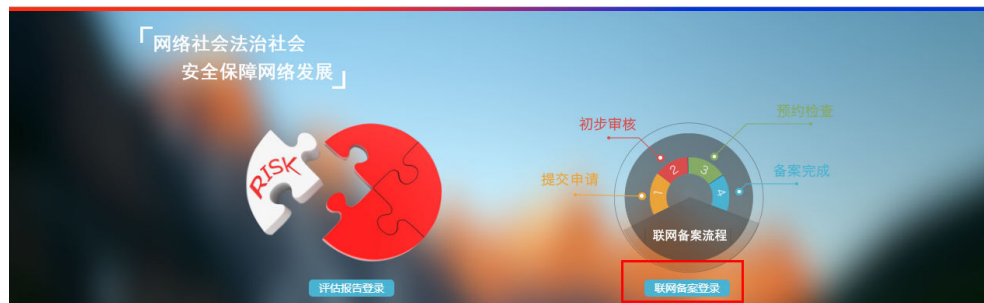
图 1-1 联网备案登录

请在网站备案成功后，网站开通30日内登录 全国互联网安全管理服务平台 ，在下载中心下载《互网站安全服务平台操作指南》，了解公安备案操作流程，并提交公安备案申请。