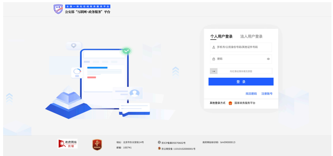
图 2-2 注册账号