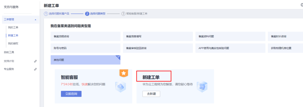
图 4-4 新建工单