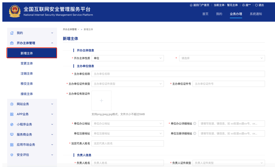
图 2-7 填写开办主体信息