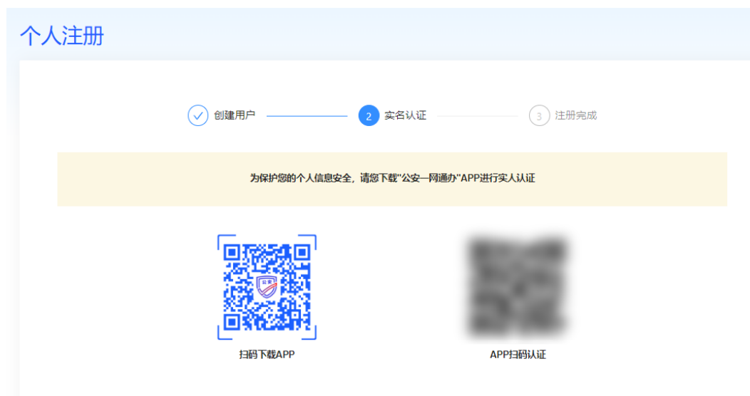
图 2-4 实人认证