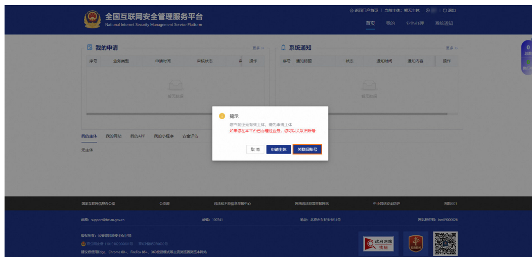
图 2-5 关联账号

8. 在关联旧账号对话框中完成相关配置项设置后，单击确认完成旧账号绑定操作，把之前的主体信息同步过来。