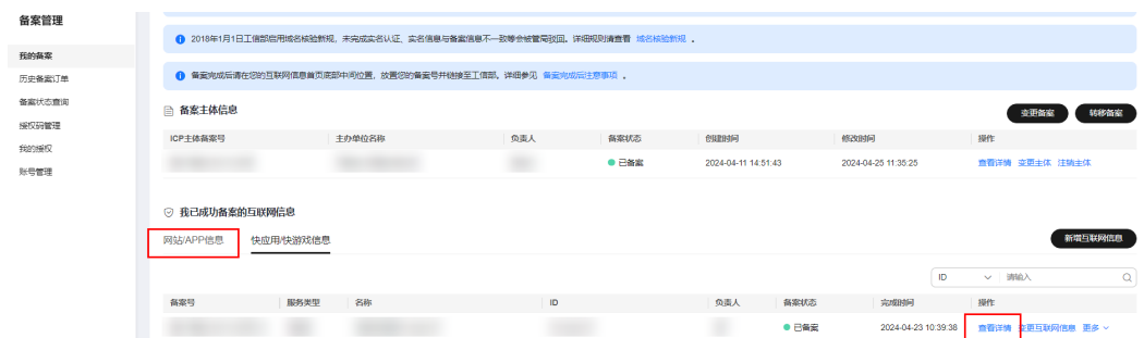
图 4-2 我已成功备案的网站