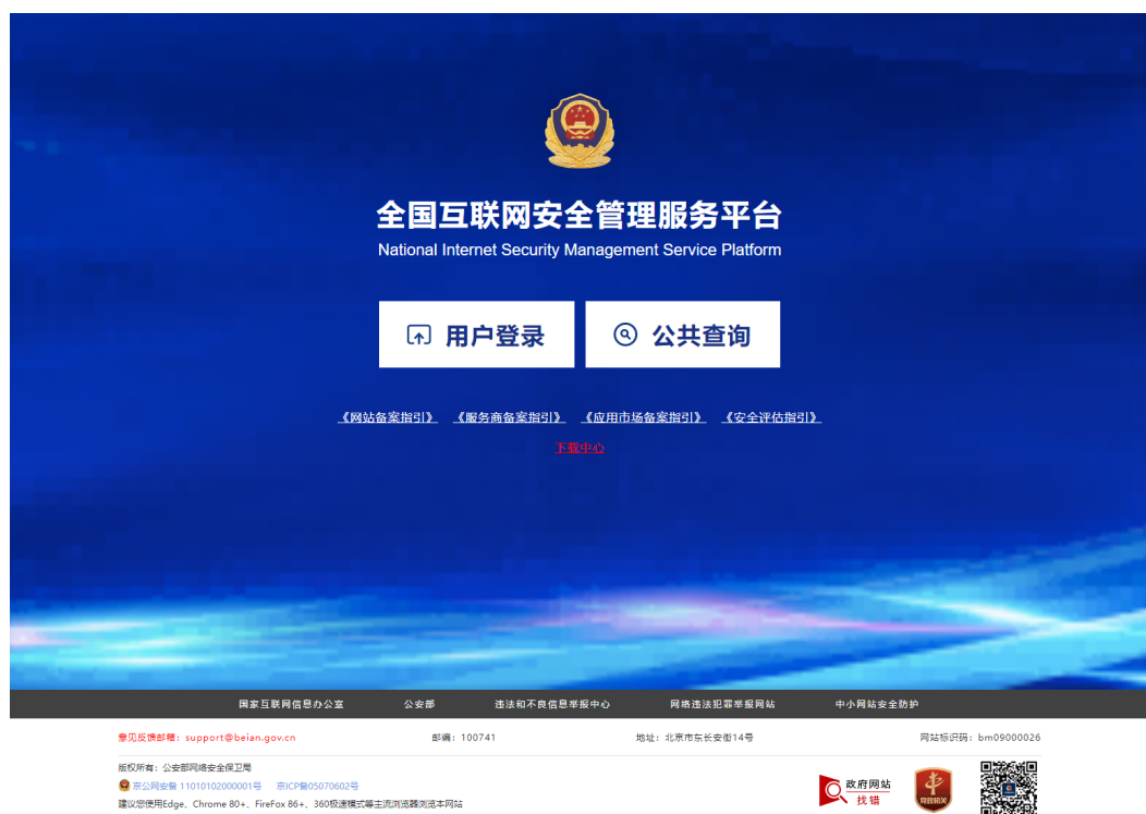
图 2-1 用户登录