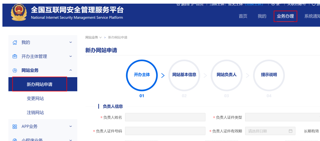
图 2-8 选择新版网站申请