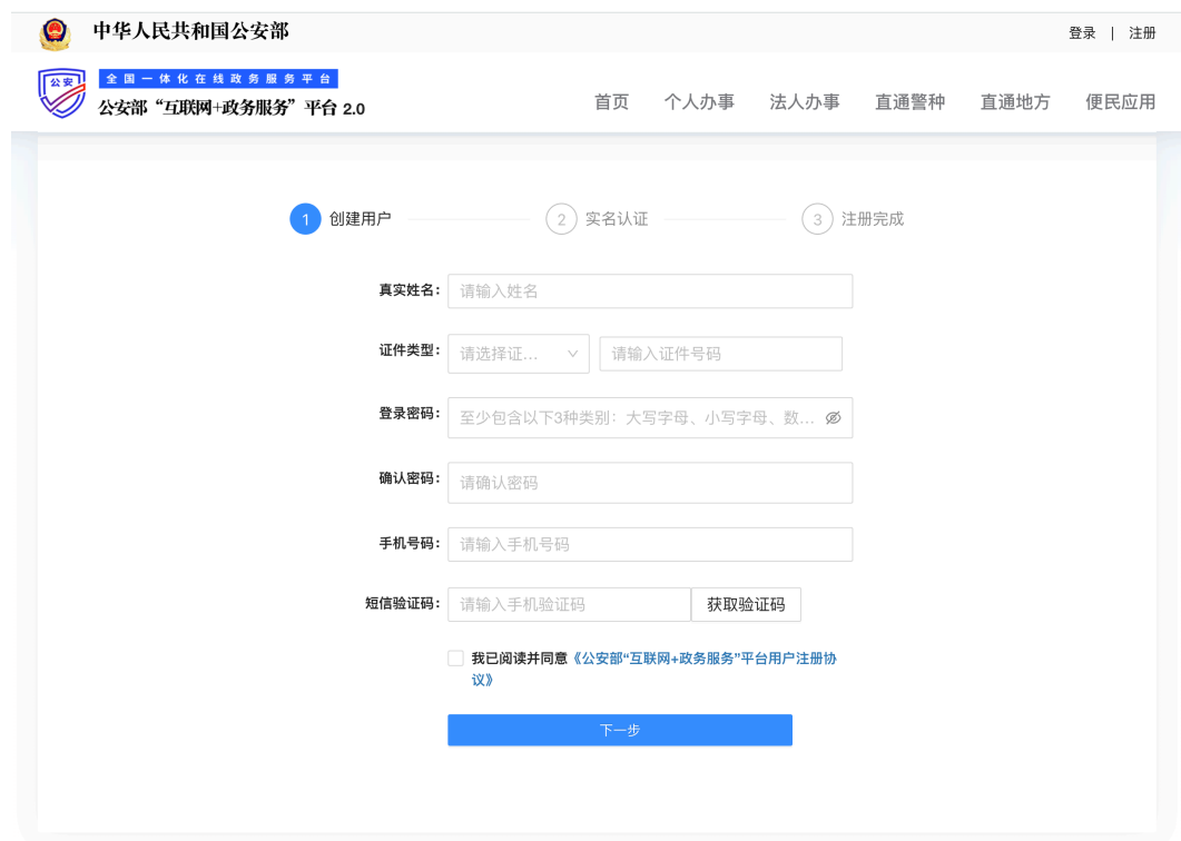
图 2-3 填写信息

4. 根据弹出二维码验证页面，请先扫描左侧二维码下载“公安一网通办”APP，再使用该APP扫描右侧二维码进行实人认证。完成互联网站安全服务平台的账号注册。