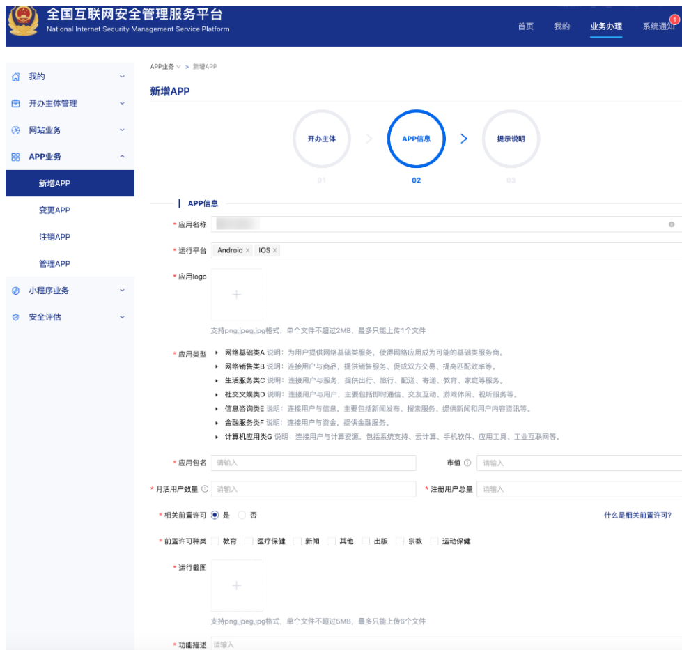
图 2-13 APP 信息