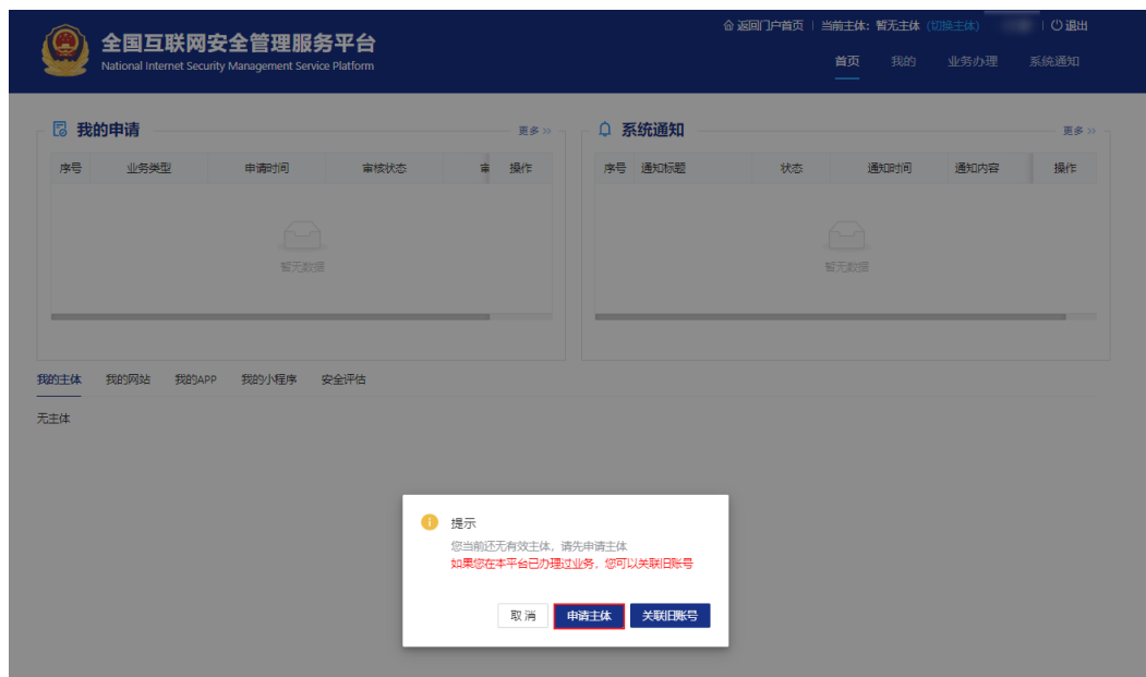
图 2-6 新增主体