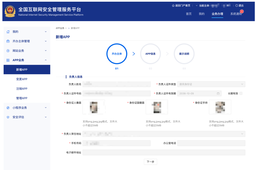
图 2-12 公安备案主体负责人信息