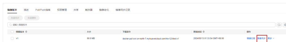
图 3-1 已有镜像的同步