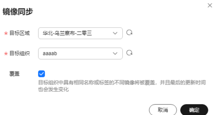
图 3-2 镜像同步