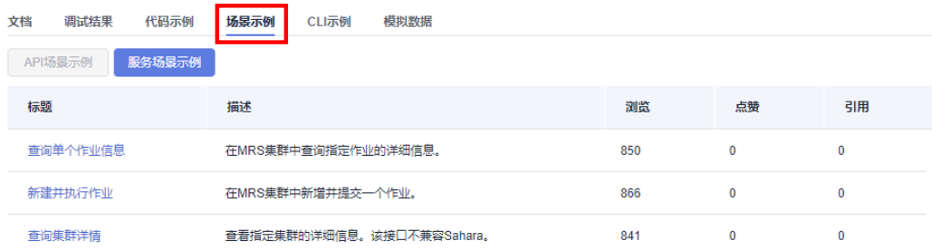
图 1-3 场景示例