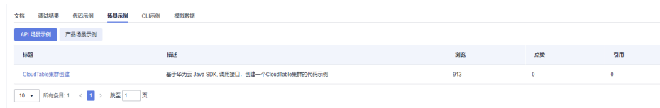
图 1-3 场景示例