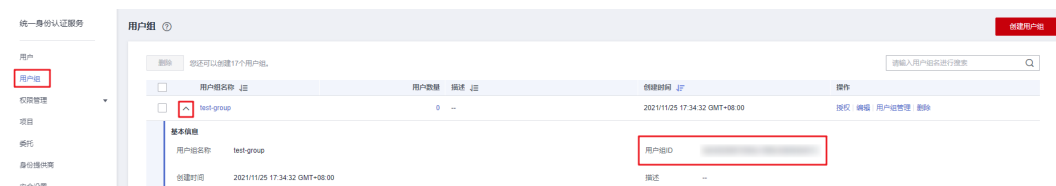
图 10-3 查询用户组名称、用户组 ID