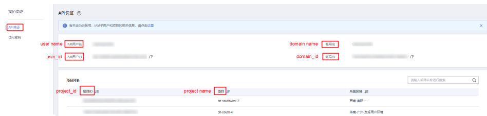
图 10-2 查看账号名、账号 ID、用户名、用户 ID、项目名称、项目 ID