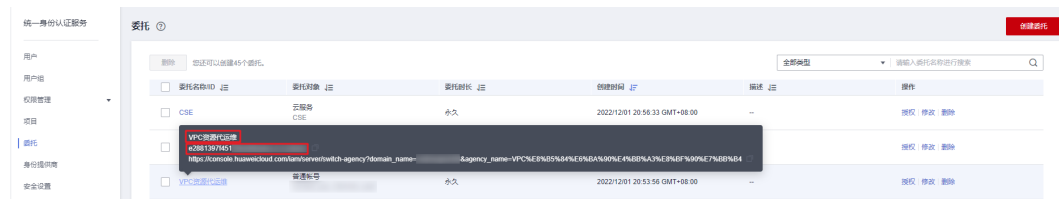
图 10-5 查看委托 ID

步骤2 鼠标移动到需要查询名称和ID的委托上，黑色框中出现的第一行为委托名称，第二行为委托ID。