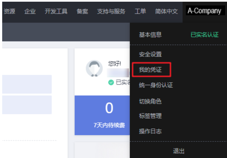
图 10-1 进入我的凭证