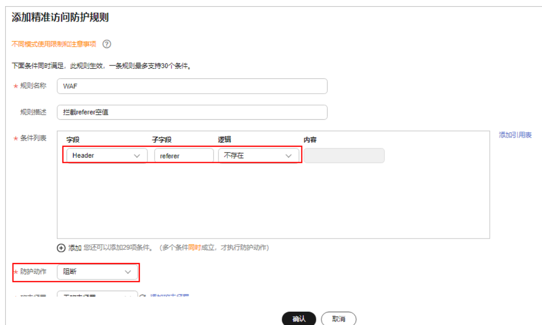
图 3-1 拦截 referer 空值

步骤4 在“精准访问防护”规则配置列表上方，单击“添加规则”，按照如 图3-1 所示进行配置。