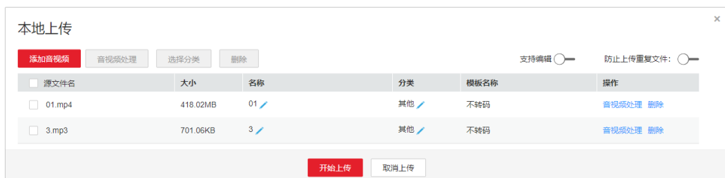
图 1-3 设置音视频处理