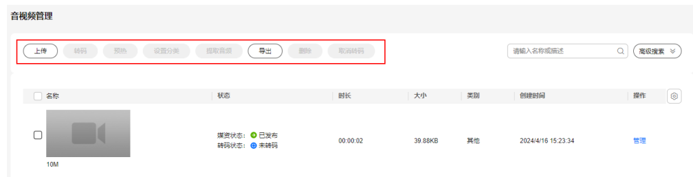
图 1-3 媒资处理