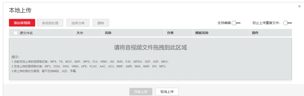
图 1-2 本地上传