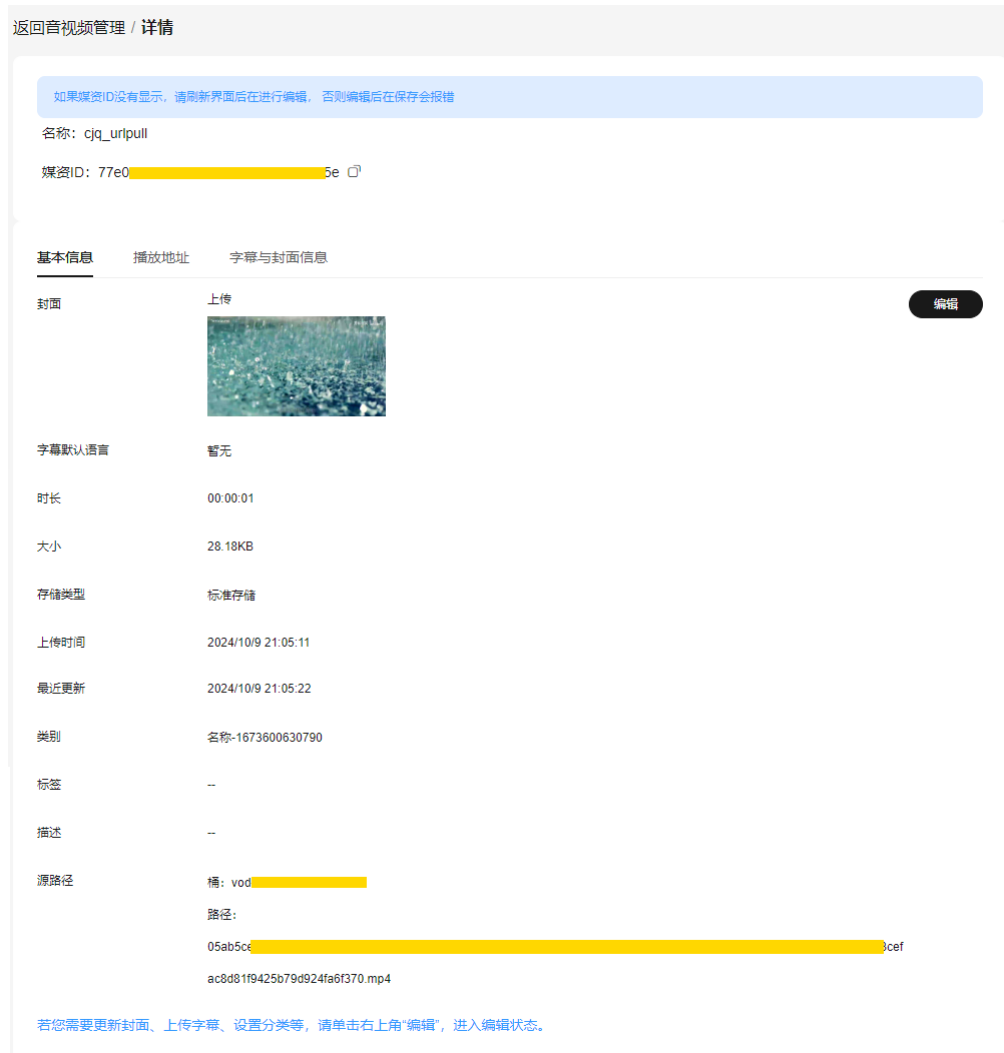
图 1-4 媒资详情