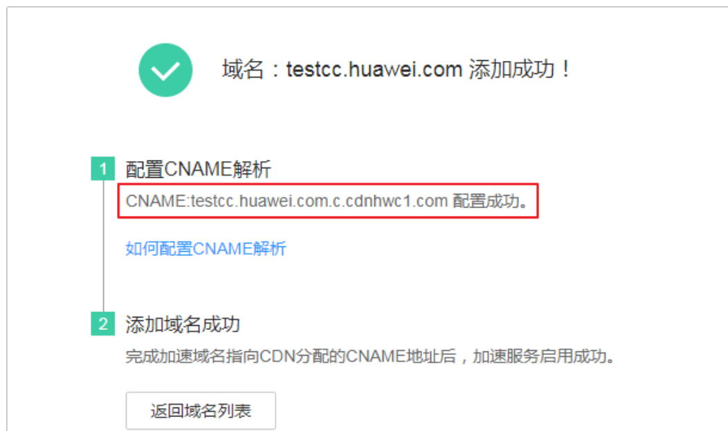
图 1-1 域名添加成功

步骤5 在域名DNS服务商处配置CNAME解析，并验证CNAME是否生效，具体操作请参见 配置CNAME 。