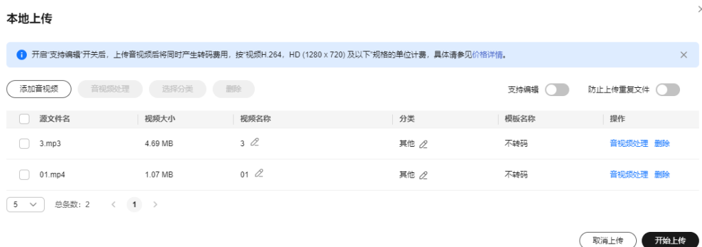
图 1-2 设置音视频处理