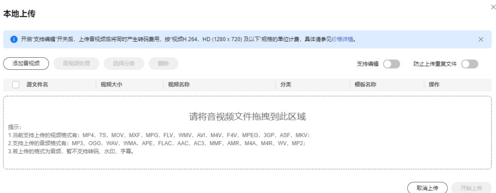
图 1-1 本地上传

步骤5 在上传页面开启“防止上传重复文件”开关，可为防止重复上传音视频文件，避免时间及存储空间浪费。