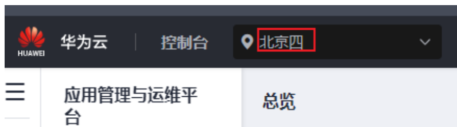
图 1-2 登录 ServiceStage 控制台

步骤2 在区域列表选择您准备使用ServiceStage的区域（例如：华北-北京四）。