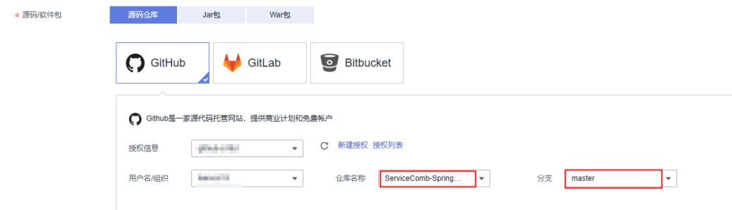
图 1-10 设置组件来源