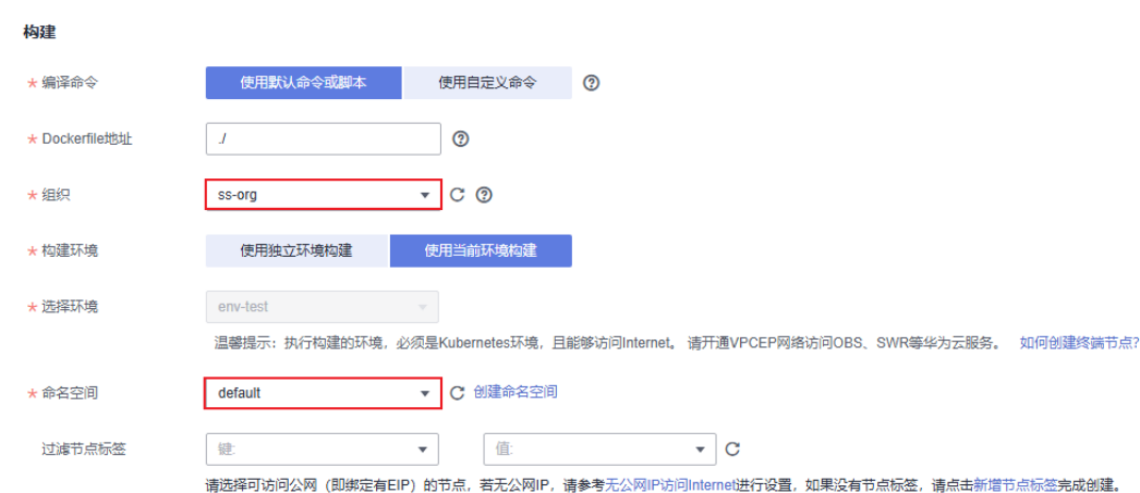
图 1-11 设置构建参数