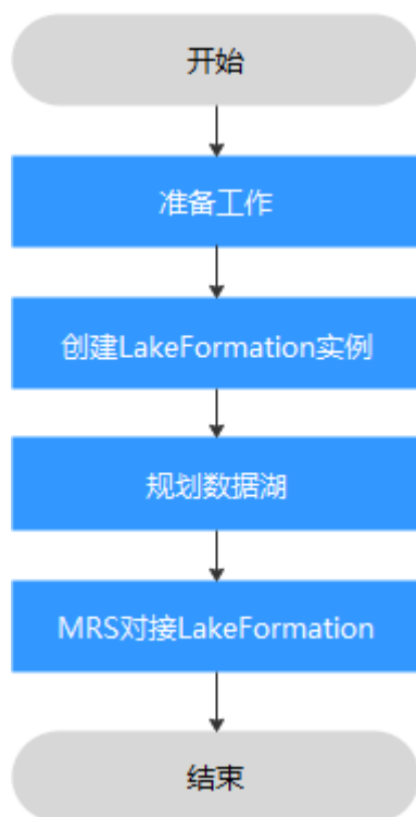
图 1-1 LakeFormation 使用流程