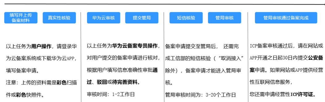
图 2-2 备案流程

备案是在服务器提供商处提交申请，用户使用华为云大陆节点服务器提供互联网信息服务，则需要在华为云提交备案申请。