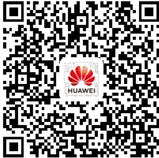
图 2-3 下载 APP