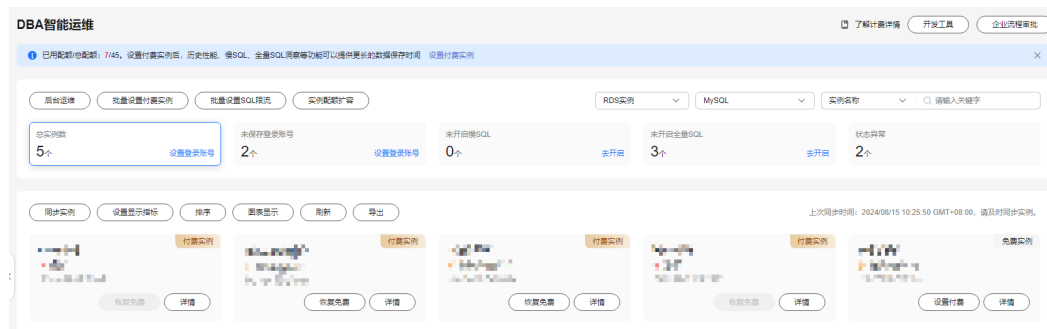
图 2-4 筛选实例