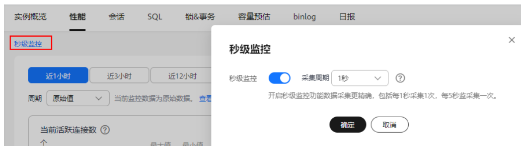
图 2-5 开启秒级监控