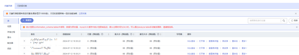
图 2-3 对象列表

步骤8 选择“对象列表”页签，您可以看到表、视图、存储过程、事件、触发器、函数等对象。