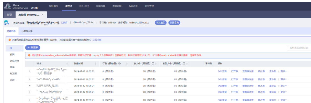
图 2-2 库管理

步骤8 选择“对象列表”页签，您可以看到表、视图、存储过程、事件、触发器、函数等对象。