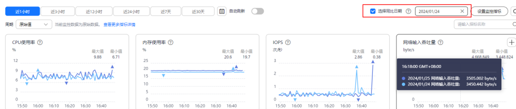
图 2-6 性能对比