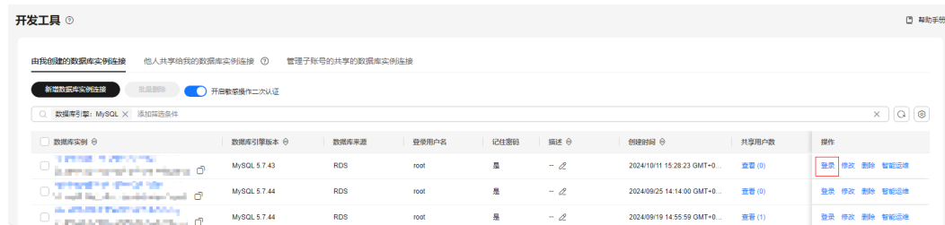
图 2-1 登录数据库