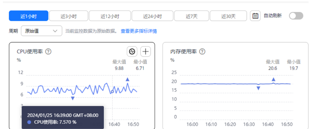
图 2-7 查看性能指标