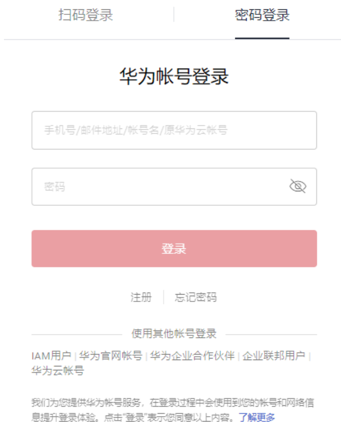
图 1-2 帐户登录