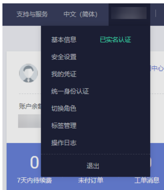
图 1-6 用户信息