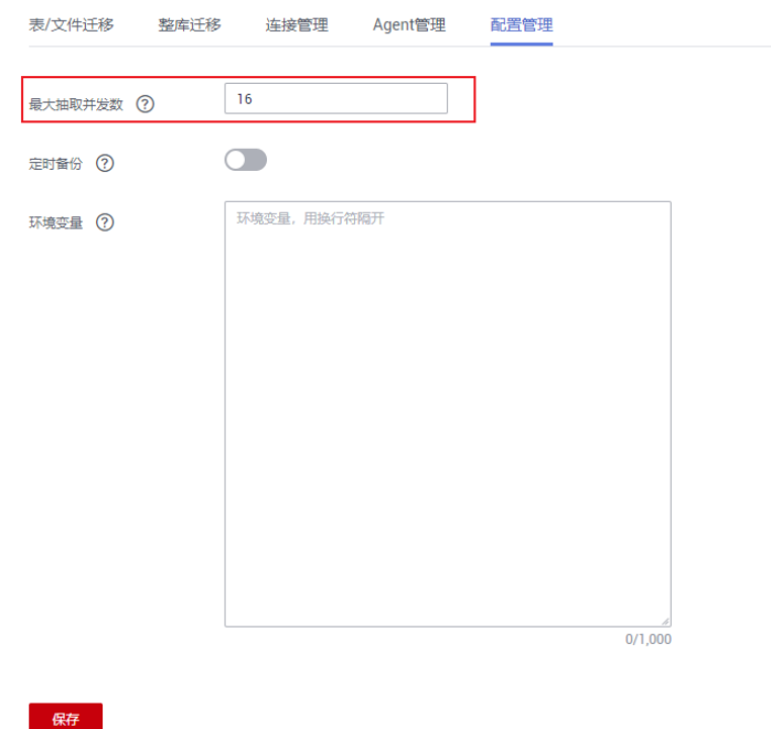
图 2-1 集群最大抽取并发数配置