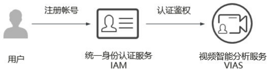
图 6-1 视频智能分析服务与 IAM 服务的关系