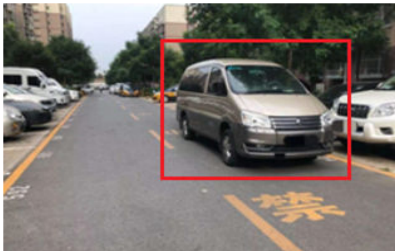
图 3-7 消防通道占用检测 1

通过消防通道占用算法，检测消防通道内物品占用和堆积的情况，并触发报警，可以有助于园区智慧高效管理。