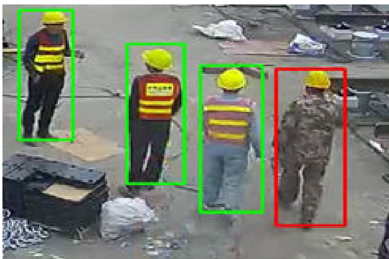
图 3-9 安全帽、反光衣未穿戴检测

基于工服工帽检测算法，通过工地入口或指定作业区域的摄像头，对人员的安全帽佩戴和反光服穿着情况进行检测，如发现有人未佩戴安全帽或者未穿反光服时，上报告警信息，并对特定人员的图片进行保存。