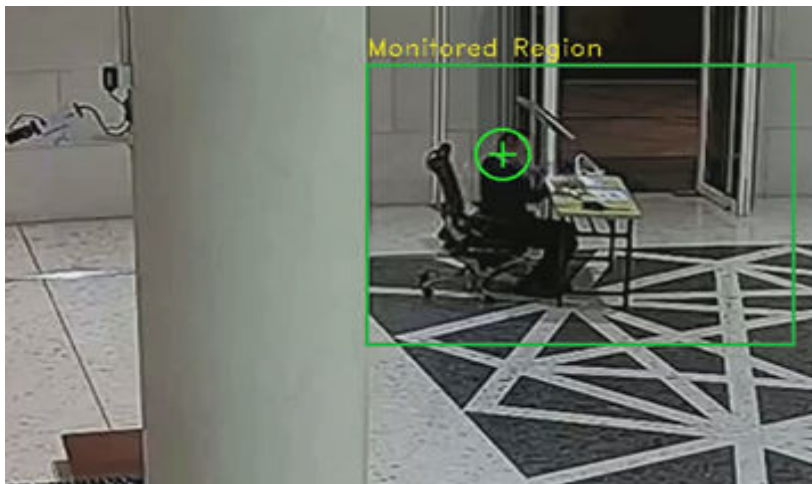
图 3-5 离岗检测 1

基于关键岗位检测算法，可以检测指定岗位区域的人员在岗情况，当指定区域内人员离岗超过设定时间时，触发报警。