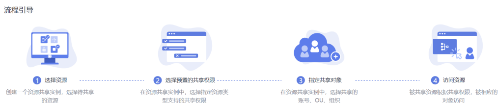
图 1-1 RAM 工作原理