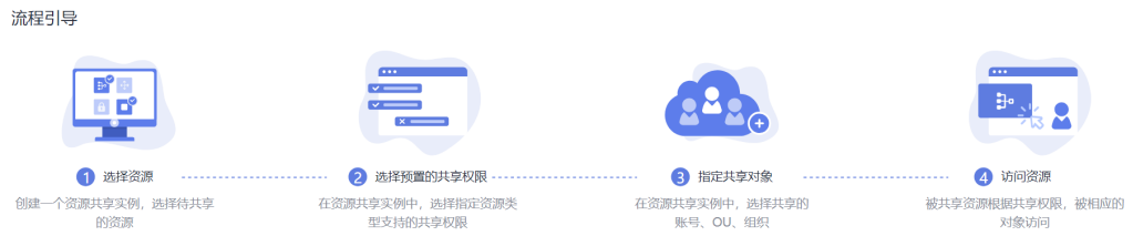
图 1-1 RAM 工作原理