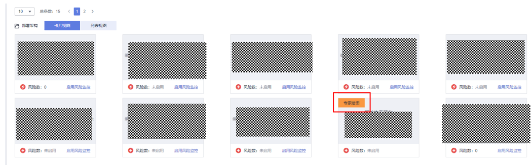
图 8-1 专家绘图