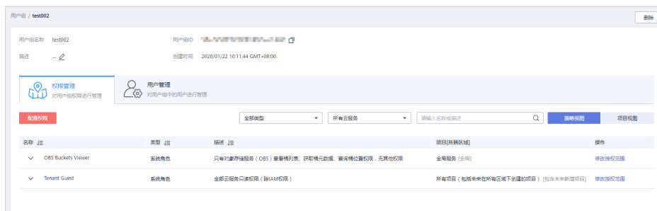
图 8-4 权限管理