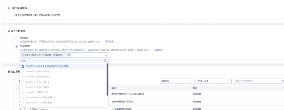
图 8-3 区域级权限配置