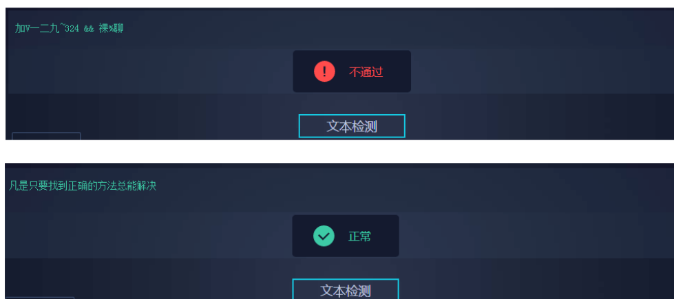
图 1-1 文本内容审核示意图

文本内容审核，采用人工智能文本检测技术有效识别涉黄、广告、辱骂、违禁品文本内容，提供定制化的文本敏感内容审核方案。