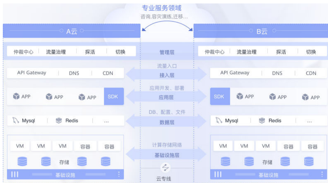
图 2-1 MAS 服务架构示意图