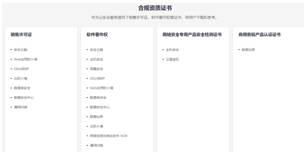
图 4-3 销售许可证&软件著作权证书

另外，华为云还提供了以下销售许可证及软件著作权证书，供用户下载和参考。具体请查看 合规资质证书 。