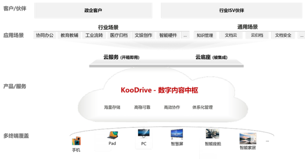
图 1-1 KooDrive 产品业务架构