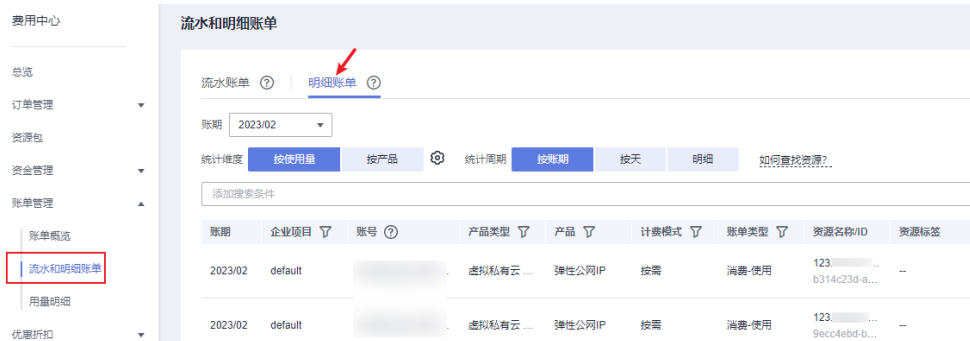
图 3-1 明细账单