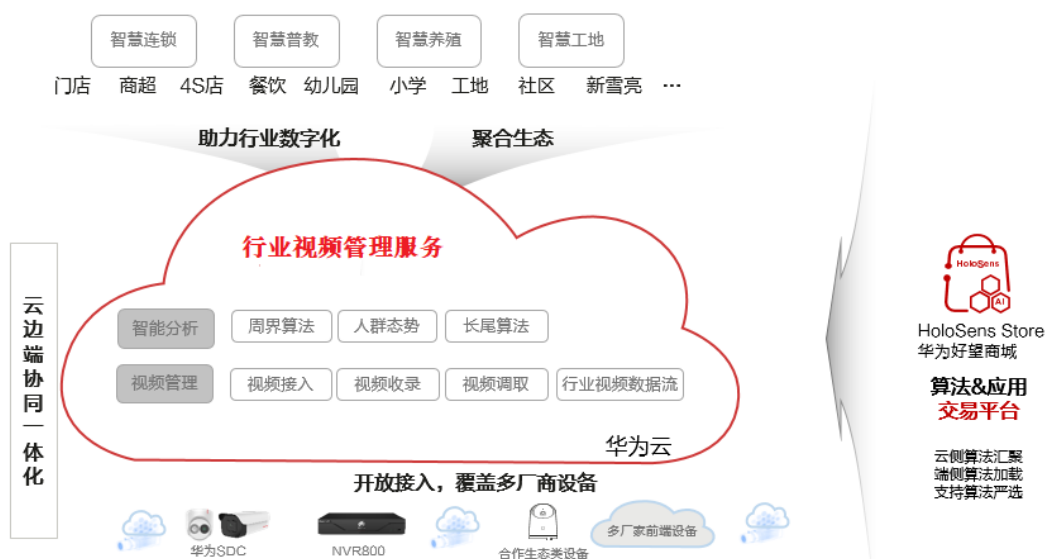
图 1-1 产品架构

行业视频管理服务提供摄像机（SDC/IPC）、网络视频录像机（NVR）、智能视频存储（IVS）等华为及第三方设备的云端视频接入管理、视频云端存储、视频实况/回放调取、视频端云协同智能分析等能力，可供软件服务商基于行业视频管理服务开发应用，如智慧连锁、智慧幼儿园等场景化解决方案。