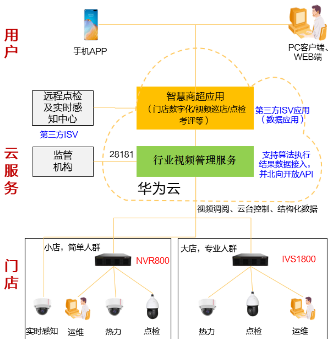
图 4-1 智慧连锁场景图（以商超为例）