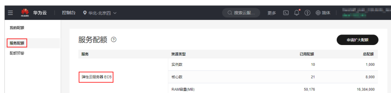
图 4-1 Flexus X 实例配额

Flexus X实例对实例数、核心数、RAM容量有配额限制。Flexus X实例和ECS共用ECS的配额，您可以通过 服务配额 查看ECS配额，了解Flexus X实例可使用的配额，如图 1。若当前配额不满足业务需要，可 申请扩大配额 。