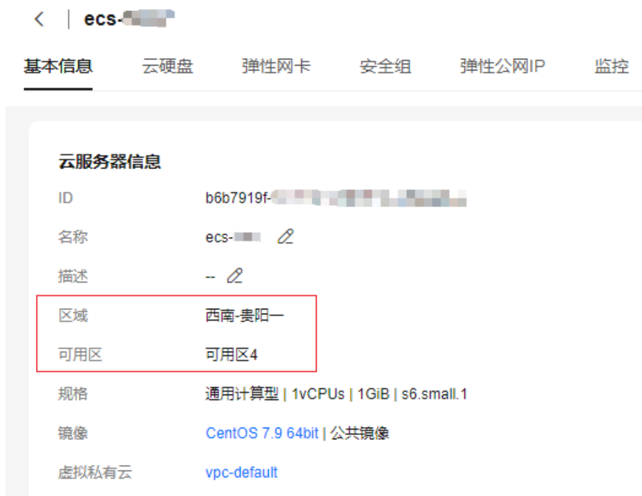
图 5-2 云服务器信息