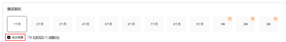
图 3-4 自动续费配置

勾选自动续费后，按月购买时自动续费周期为1个月，按年购买时自动续费周期为1年。例如，您选择了购买时长3个月，并开通自动续费，则在每次到期前自动续费1个月。更多关于自动续费的规则介绍请参见 自动续费规则说明 。