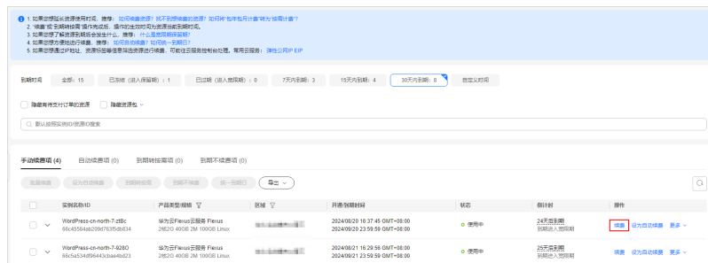
图 3-2 单个续费