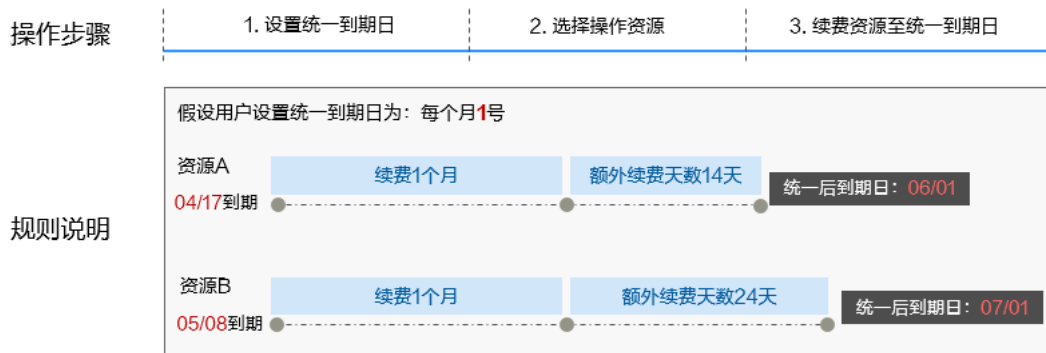
图 3-5 统一到期日

图3-5展示了用户将两个不同时间到期的资源，同时续费一个月，并设置“统一到期日”后的效果对比。