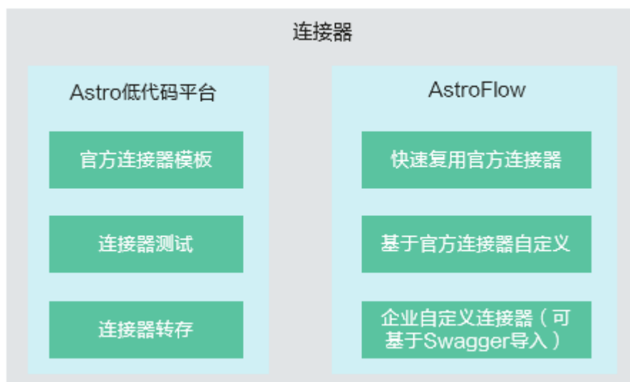
图 8-2 连接器