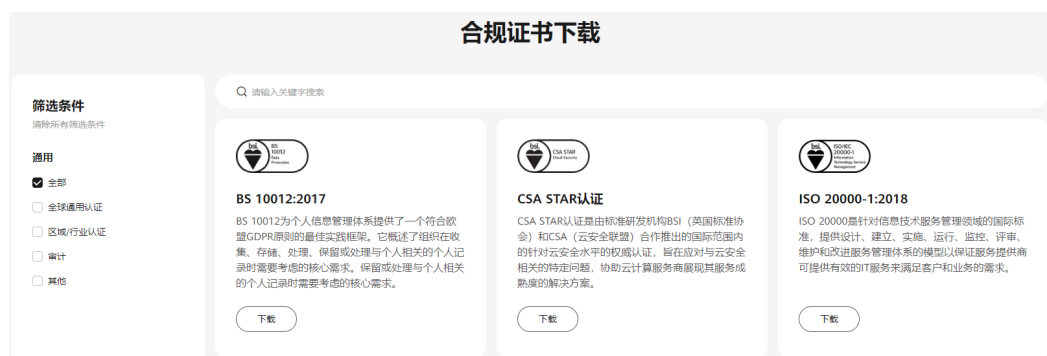
图 5-2 合规证书下载

华为云服务及平台通过了多项国内外权威机构（ISO/SOC/PCI等）的安全合规认证，用户可自行 申请下载 合规资质证书。