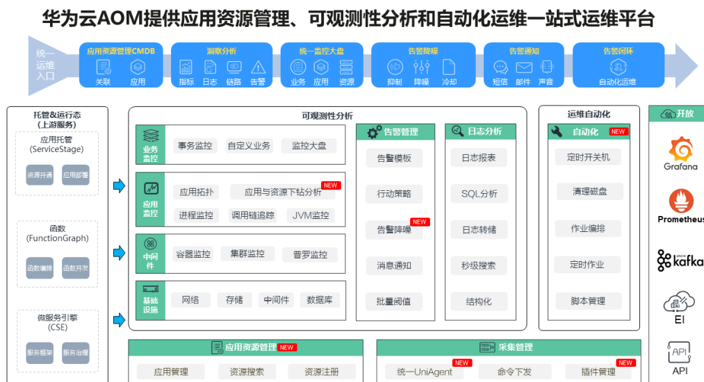
图 1-1 AOM 产品结构图

应用运维管理（Application Operations Management，简称AOM）是云上应用的一站式立体化运维管理平台，融合云监控、云日志、应用性能、真实用户体验、后台链接数据等多维度可观测性数据源，提供应用资源统一管理、一站式可观测性分析和自动化运维方案，帮助用户及时发现故障，全面掌握应用、资源及业务的实时运行状况，提升企业海量运维的自动化能力和效率。