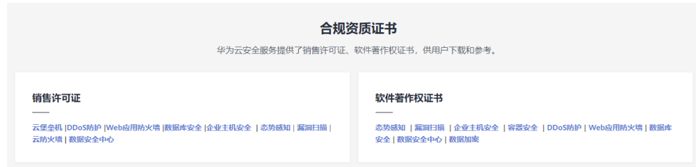
图 9-5 销售许可证&软件著作权证书

另外，华为云还提供了以下销售许可证及软件著作权证书，供用户下载和参考。具体请查看 合规资质证书 。