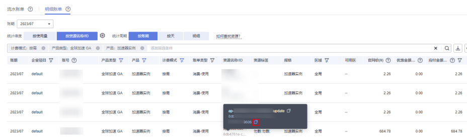
图 7-1 复制资源 ID