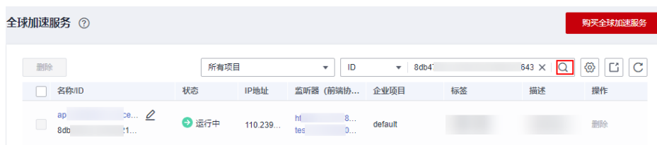
图 7-2 查找资源