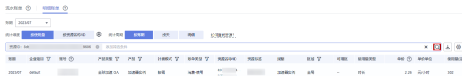
图 5-2 查询资源账单

这里设置的统计维度为“按使用量”，统计周期为“按账期”，您也可以设置其他统计维度和周期，详细介绍请参见 流水与明细账单 。