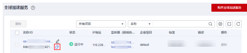
图 5-1 获取资源 ID