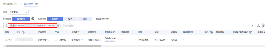
图 7-3 查询资源账单

这里设置的统计维度为“按使用量”，统计周期为“按账期”，您也可以设置其他统计维度和周期，详细介绍请参见 流水与明细账单 。