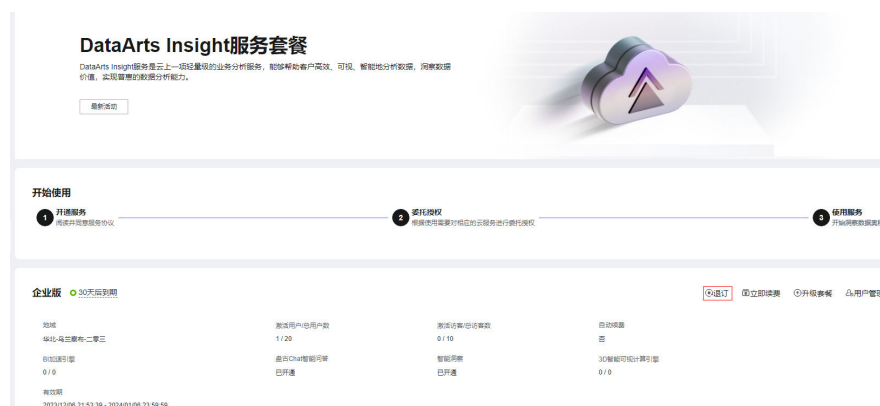
图 9-1 退订费用

步骤3 单击“退订”，进退订资源页面，选择退订原因勾选“我已确认本次退订金额和相关费用”、“资源退订后，未放入回收站的资源将立即删除且无法恢复。我已确认数据完成备份或不再使用”，然后单击“退订”。