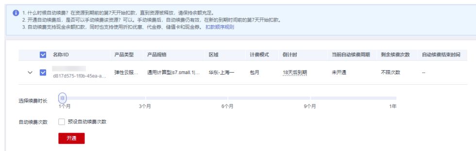
图 6-5 开通自动续费

在“续费管理”页面开通的自动续费，自动续费周期以实际选择的续费时长以及自动续费次数为准。例如：您选择了续费时长3个月，不限次数，即在每次到期前自动续费3个月。