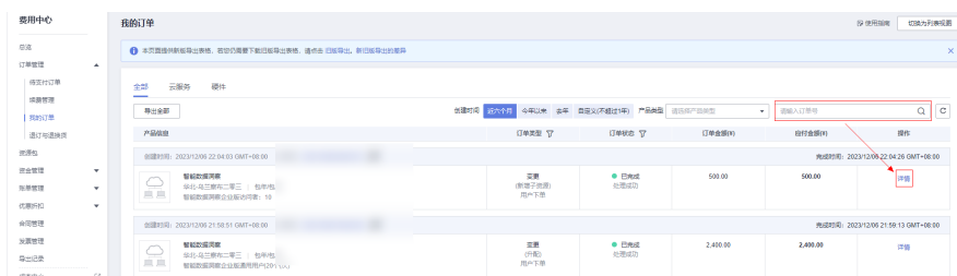
图 7-1 我的订单页面