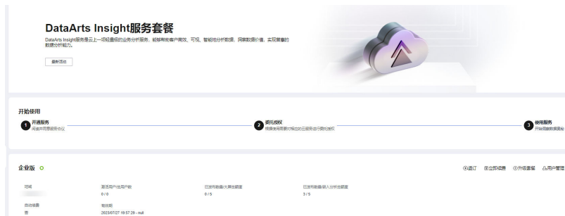
图 6-2 费用管理页面