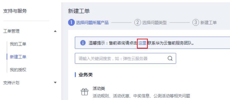
图 9-1 新建工单