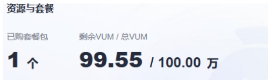
图 9-2 查看 VUM

VUM额度的扣除周期是一个小时，可能会出现实际消耗和当前套餐包余额不一致的情况，请耐心等待下一个计费周期。