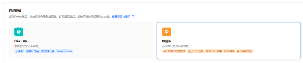
图 3-1 选择套餐规格