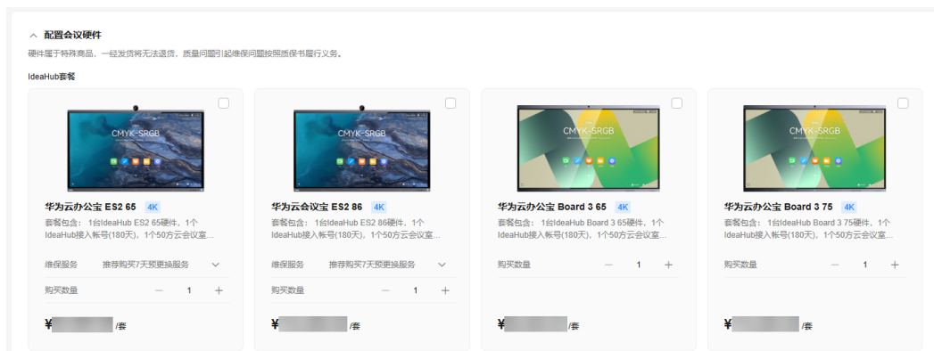
图 3-4 配置会议硬件