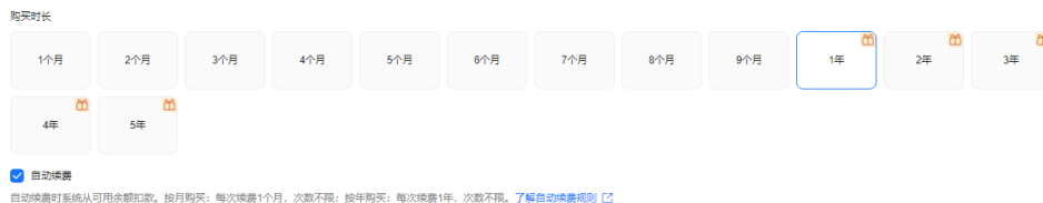
图 3-2 选择购买时长

步骤5 配置云资源。勾选对应的会议资源规格，并设置购买数量，可选择并发端口、云会议室、网络研讨会、会议室设备接入账号、会议室连接器、录播空间、直播端口资源。