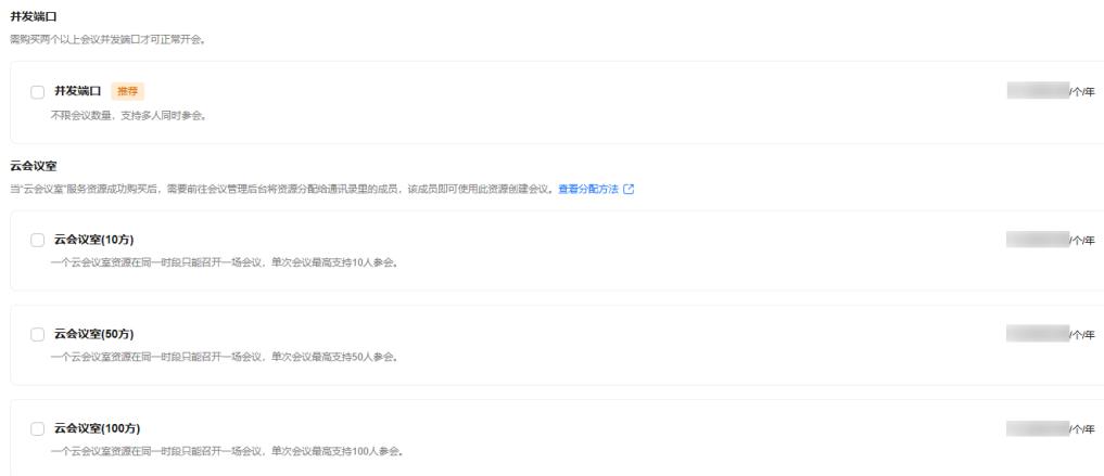
图 3-3 配置会议资源