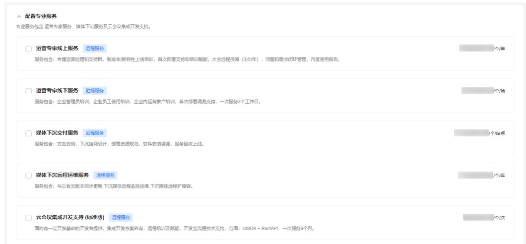
图 3-5 配置专业服务