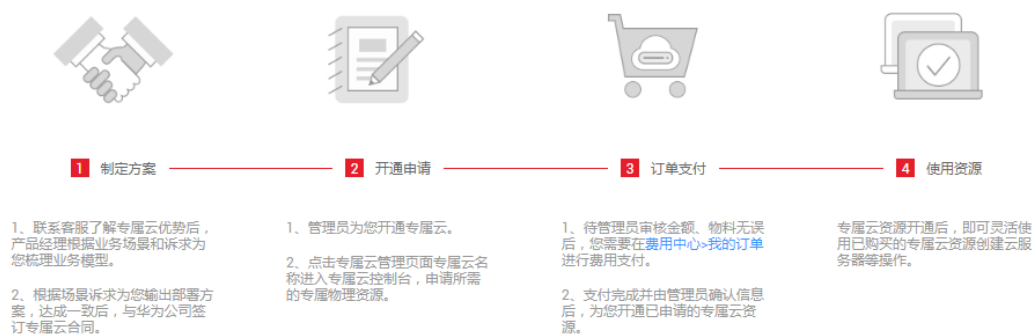
图 1-1 申请流程

申请专属计算集群资源前，需要先开通专属云服务。请为各环节预留充足时间，确保可以按时使用专属云。