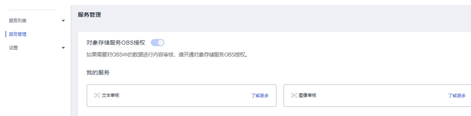
图 1-1 我的服务

服务开通后，已申请的服务可在内容审核服务控制台的“服务管理”页面内查看，如不想再使用本服务，无需关闭，不调用即可。