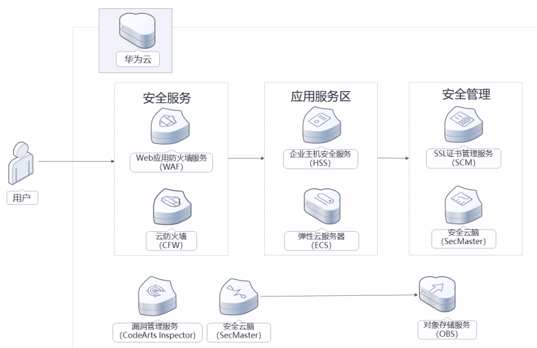
图 1-1 方案架构图