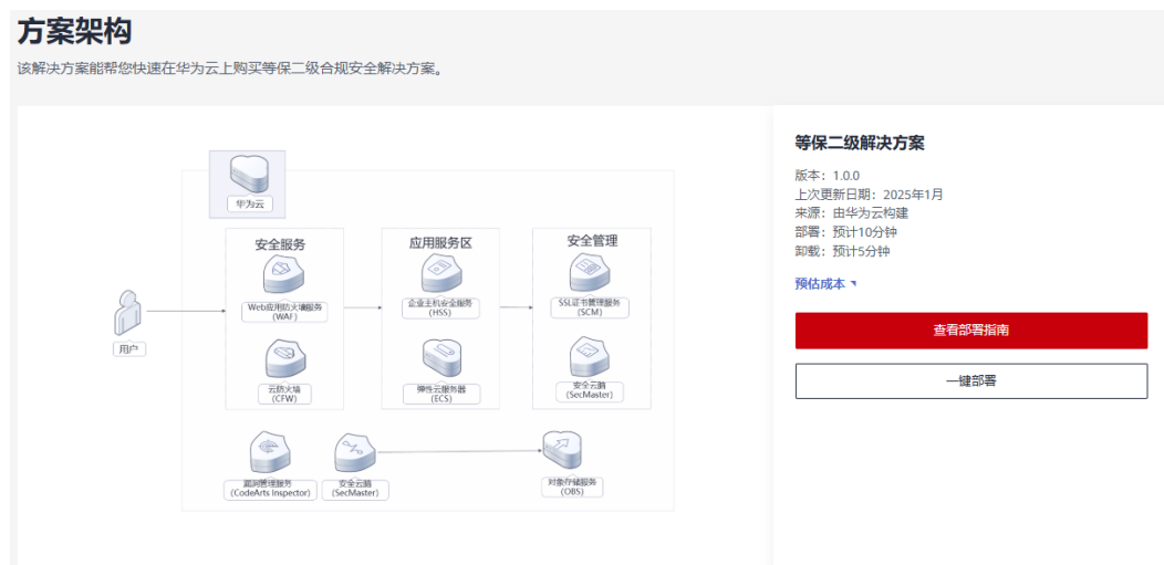
图 3-1 解决方案实施库

步骤1 登录 华为云解决方案实施库 ，选择模板一键部署，跳转至解决方案一键部署界面。