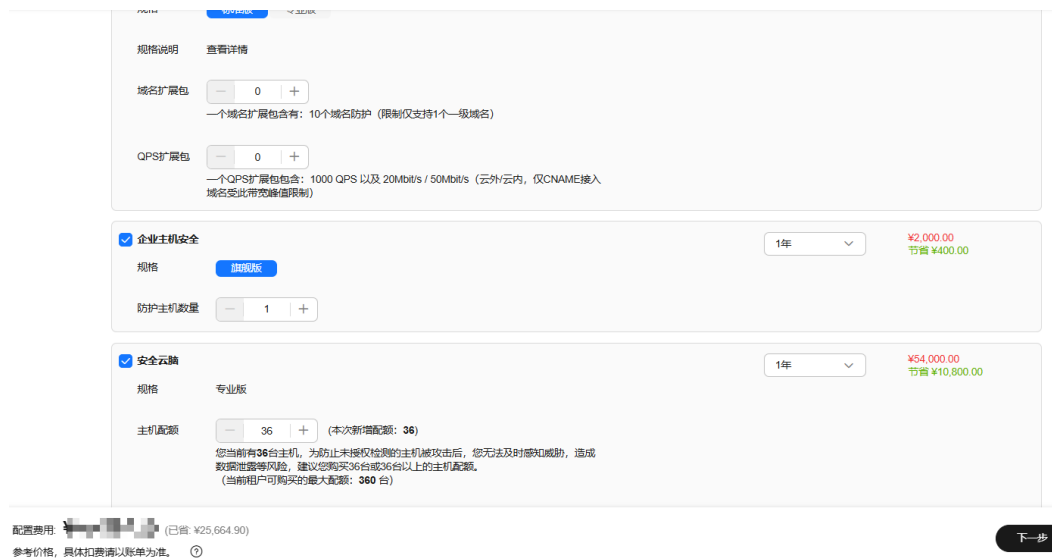
图 3-3 确认订单

步骤3 企业主机安全、安全云脑，会根据账号使用情况进行计算配置数量，其它服务按默认即可。单击“下一步”，勾选协议，单击“去支付”并确认订单后，即可完成资源创建。