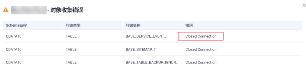
图 3-1 错误显示

执行数据库评估项目，“项目状态”中的“对象收集错误”显示错误“Closed Connection”。