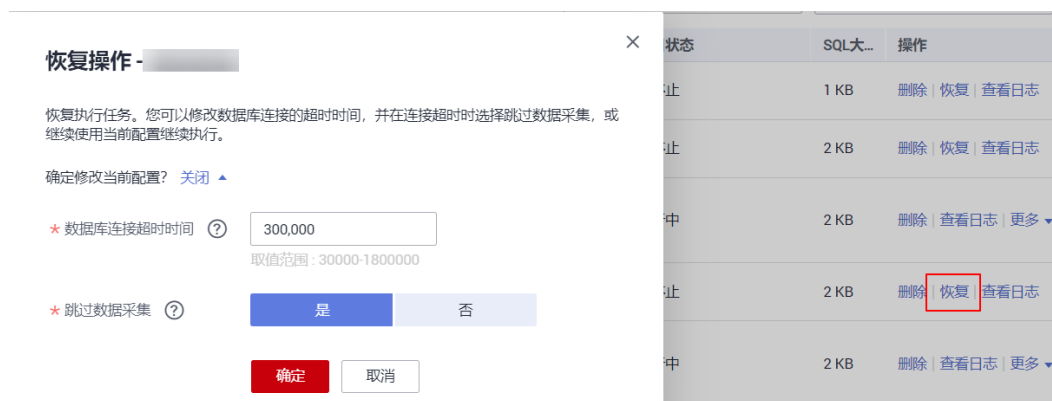
图 3-2 恢复操作