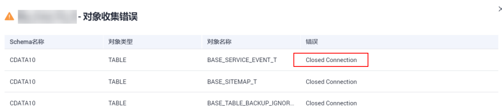
图 3-1 错误显示

执行数据库评估项目，“项目状态”中的“对象收集错误”显示错误“Closed Connection”。