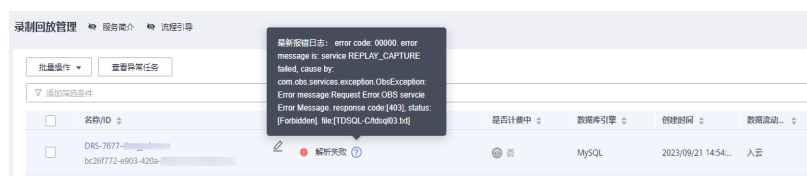
图 2-4 解析失败

客户创建入云录制回放任务时，通过AK/SK获取OBS桶内流量文件，任务解析流量文件失败，提示OBS连接失败。