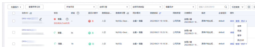
图 2-1 跳过 DDL