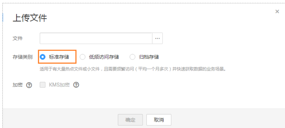
图 2-2 上传文件