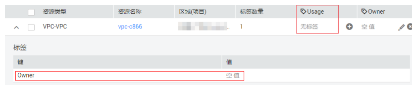
图 1-1 示例

该VPC资源已关联了标签，此标签“键”为“Owner”，“值”默认为空值。标签键“Usage”未与此VPC资源关联，若需要此标签键生效，则需要输入具体的“值”。