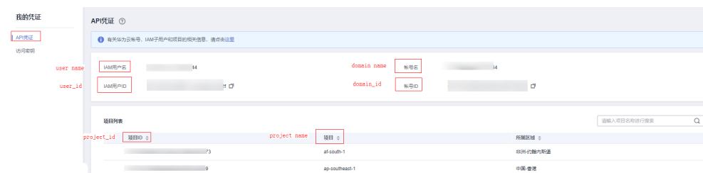
图 3-1 我的凭证

如果您的华为云帐号已升级为华为帐号，将不支持获取Token。建议您为自己创建一个IAM用户，获取IAM用户的Token。