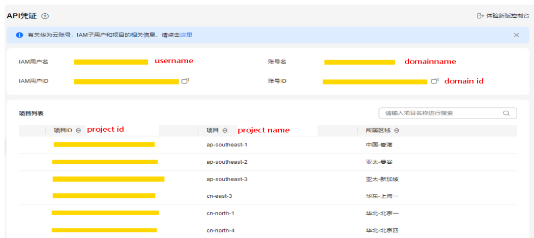
图 5-2 获取项目 ID