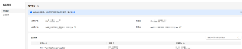
图 10-2 我的凭证