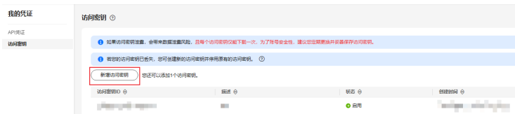
图 10-1 获取 AK、SK