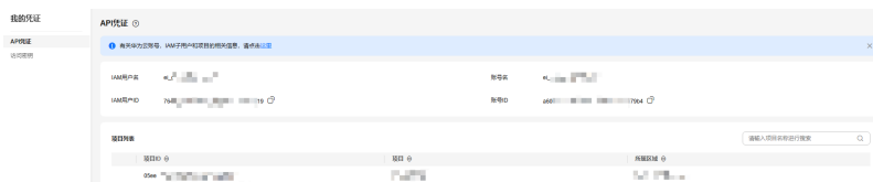
图 9-2 我的凭证