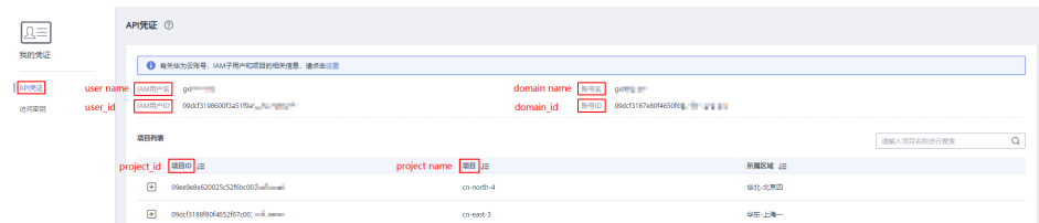
图 14-2 查看账号名、账号 ID、用户名、用户 ID、项目名称、项目 ID